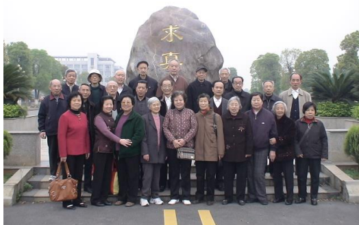
参观东（新）校区 在求真石前合影