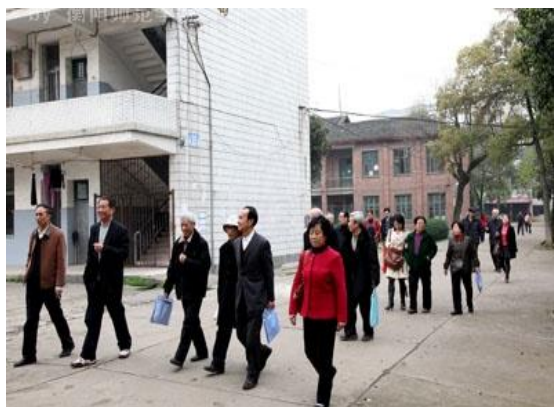
参观西(老)校区 后面二楼就是我们当年教室